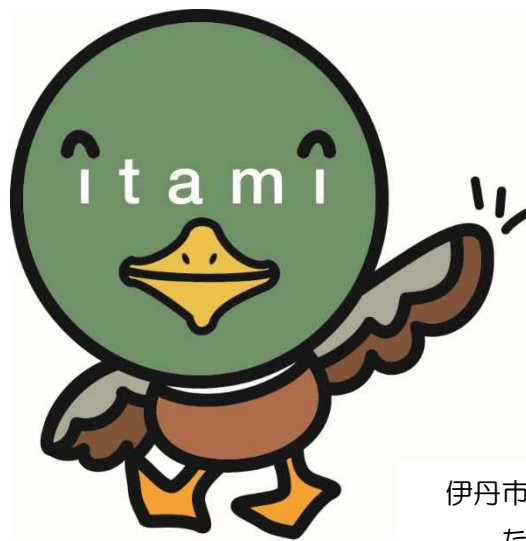
伊丹市マスコット たみまる